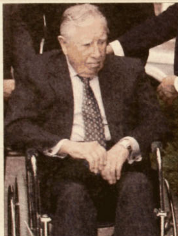
bra de los uniformados.

En los partidos oficialistas, se impone la tesis de primero el desafuero y la casi convicción de que ése será el fallo de la Corte. Hay conciencia de que una resolución judicial así impactará fuerte en el mundo militar, pero también confianza en que ello no debería significar una situación de inestabilidad grave. Entre otras razones, porque ven muy escaso el margen de manio-