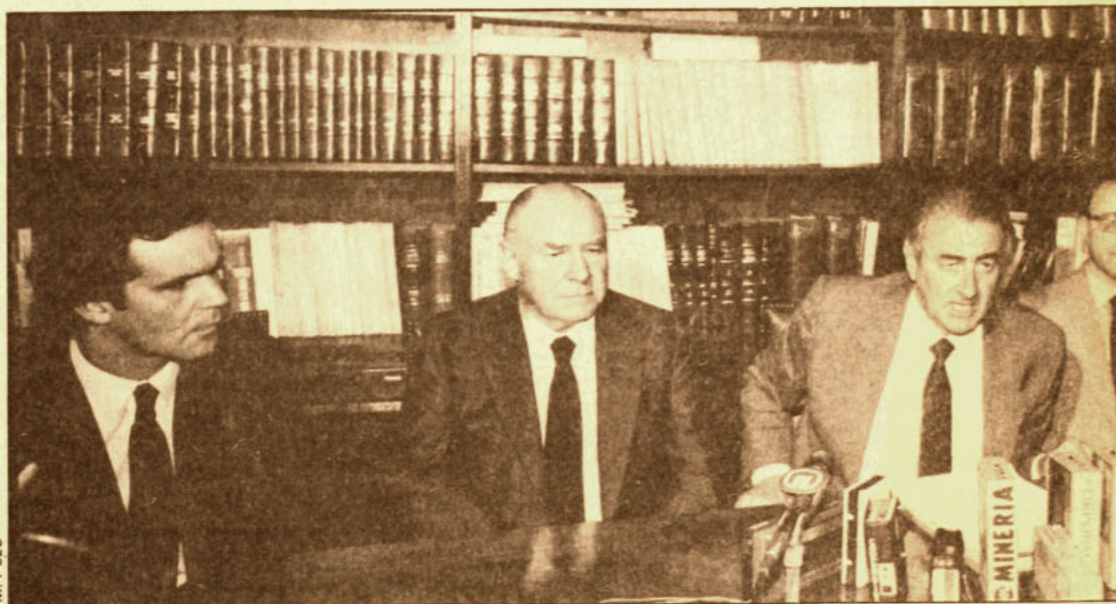
Renovación Nacional: ¿qué pasa con ella?