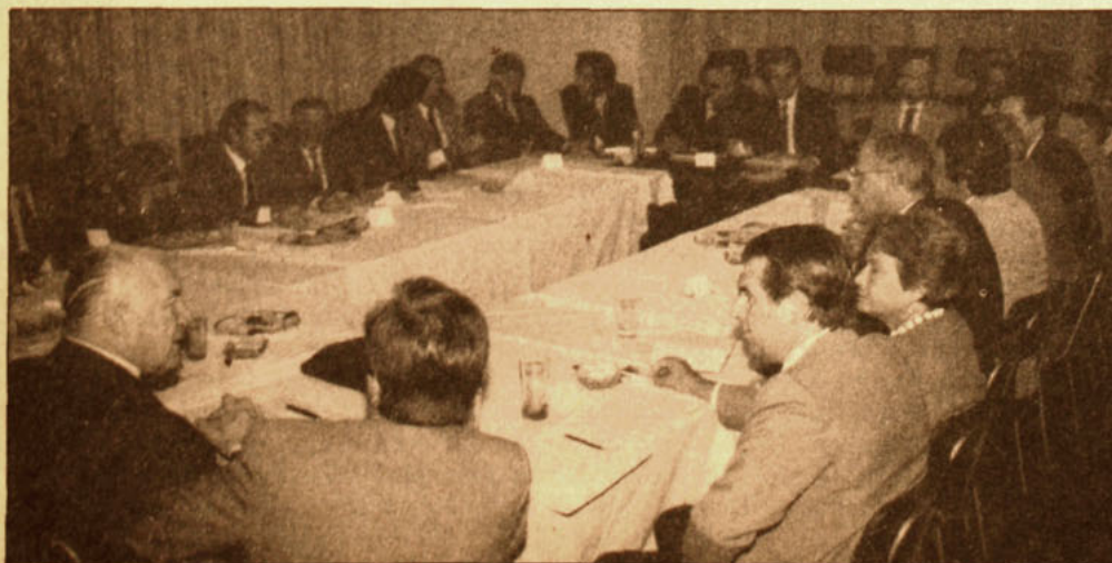
La comisión de RN en pleno: definirse sobre la sucesión. Punto pendiente.