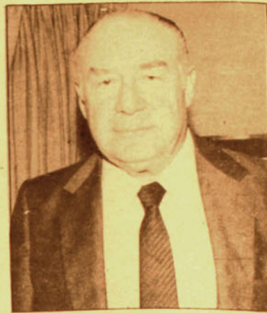
Con una larga trayectoria política, Sergio Onofre Jarpa asume la presidencia de Renovación Nacional para comenzar un arduo trabajo.