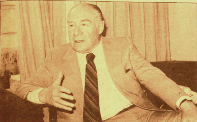
Sergio Onofre Jarpa: "He señalado en anteriores oportunidades que era mejor para el país una elección abierta, pero hay que ser realistas".

Primero, porque creo que era la forma más adecuada de llegar a la plenitud democrática -como se ha dado en llamar- y, por otro lado, facilita el éxito de la posición del gobierno. Pero hay que ser realistas y las cosas se van a dar a través de la fórmula de plebiscito