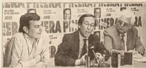
José Piñera hizo anuncios sobre la modernización del Estado.

Aseguró José Piñera, quien lo propondrá. También dijo que ciertos ministerios deberían estar en regiones.