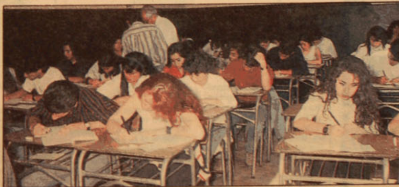
Con absoluta normalidad y pocos nervios, unos 140 mil jóvenes rindieron ayer los primeros exámenes de la Prueba de Aptitud Académica a través de todo el país.

■ No la dio sólo el 5 % ■ Para algunos fue "papa"