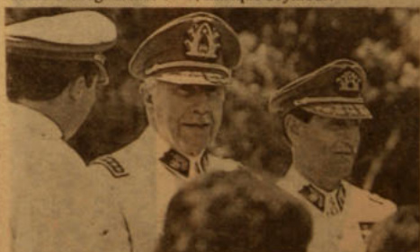
"Estoy mandando un documento a la Presidencia", dijo el general Pinochet y dijo que no podía hablar más.