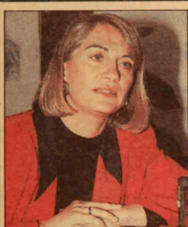
Evelyn Matthei manifestó su confianza en que todo saldrá bien.