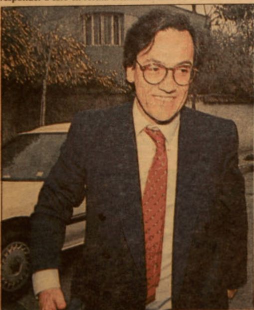
Senador Sebastián Piñera: "Jamás pensamos que fuésemos a terminar con estas encargatorias de reo".

Sobre la resolución que deberá emitir el Tribunal Supremo de Renovación Nacional, que analiza sanciones para los militantes involucrados en el caso, Sebastián Piñera dijo que es de esperar que sea "un fallo en justicia, en conciencia, que a cada uno se le aplique el castigo que se merece, de acuerdo a las faltas cometidas. Que no sea un fallo que intente equilibrio o compensaciones políticas".