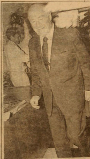
Jarpa: "Los médicos me recomendaron que no me relacionara con personas de doble fondo".

En este nuevo capítulo del duelo verbal de los dos senadores de Renovación, el experimentado parlamentario comentó que "los médicos me recomendaron que no me relacionara con personas de doble fondo por el mismo problema de las maletas de los contrabandistas, en que uno se encuentra con sorpresas".