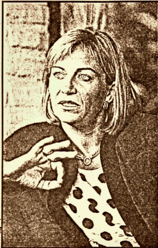
Diputada Evelyn Matthei

La evaluación negativa de la diputada Evelyn Matthei es casi idéntica en hombres y mujeres.