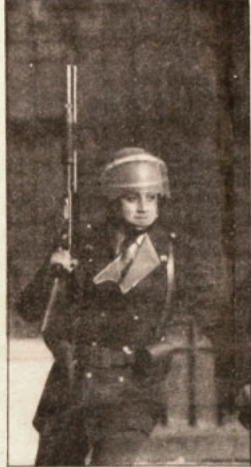
Un carabiniero en la Facultad de Ingeniería de la U. de Chile.