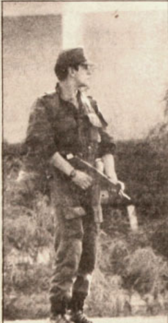
Un miembro del GOPE monta guardia cerca del ex Pedagógico.