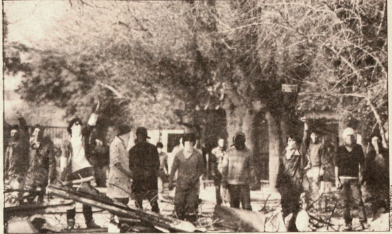
Manifestantes junto a una barricada en Grecia con Macul.

Movimiento se desarrolló en varias ciudades del país