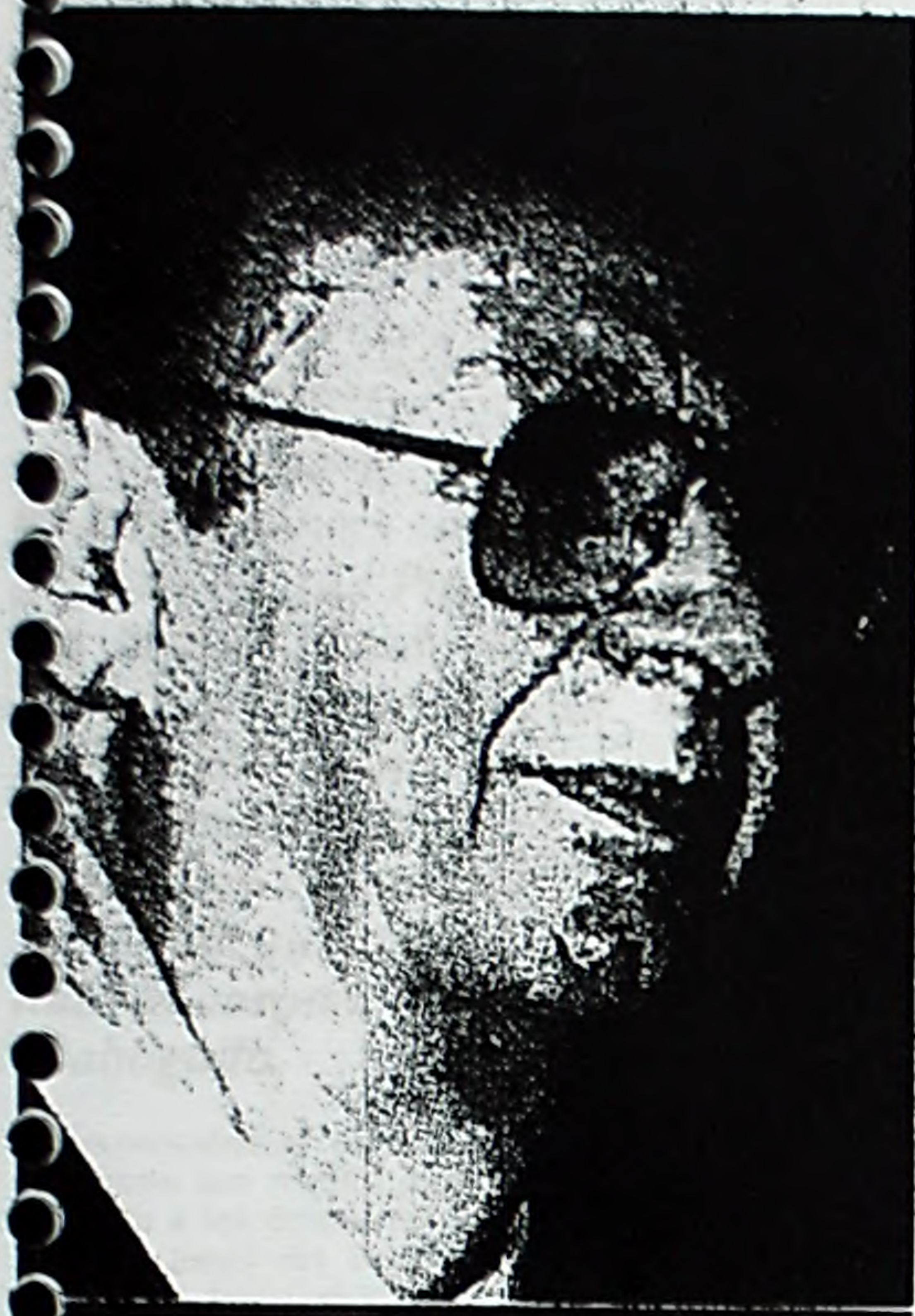
Ministro José Benquis